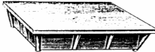
شكل رقم (١٥)