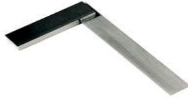
شكل رقم (١٤)

وهي كما في الشكل رقم (١٤) وتستخدم لقياس الزوايا على أسطح وأطراف المشغولات للزاوية (٩٠°)، وهي تتكون من جناحين وضع كل منهما قائم الزاوية بالنسبة للآخر وأحد هذين الجناحين سميك، لتركيز وضع الزاوية على الشغل المراد اختباره .